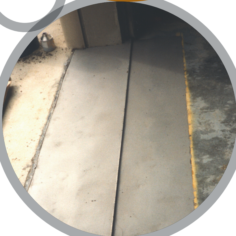
Zonas con problemas en el suelo

Para más información, por favor contacte a su representante local Belzona