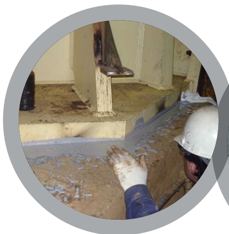
Base de equipo