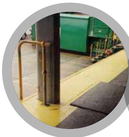
Muelles de carga