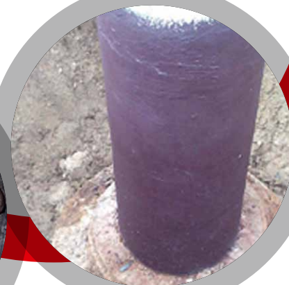
Reparaciones de defectos en paredes desgastadas