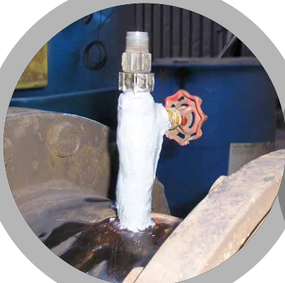
Sellado de filtraciones en tuberías