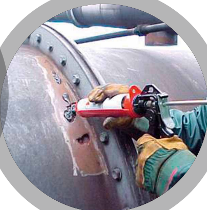
Relleno de picaduras de corrosión