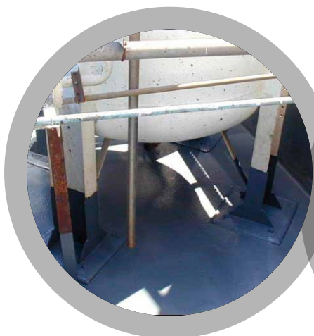
Áreas de contención de sustancias químicas