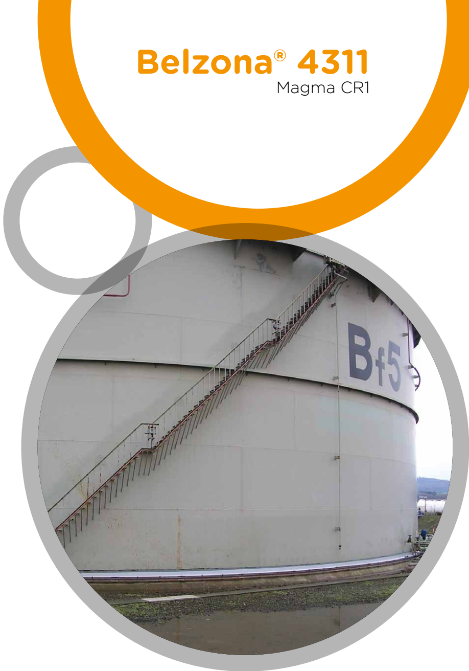
Tanques de almacenamiento de sustancias químicas

Para más información, por favor contacte a su representante local Belzona